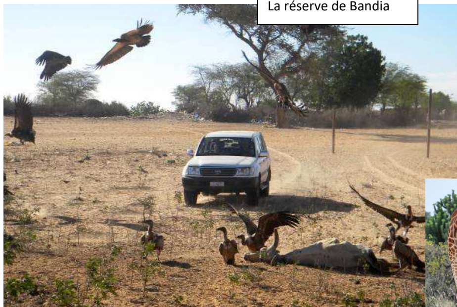
La réserve de Bandia

Jour 4 : vous allez quitter la belle région du Saloum pour le début de votre safari 4X4. Celui-ci va vous emmener vers les pistes et les forêts de la région ainsi que des petits villages de huttes. Passage le village natale de Senghor la premier président du Sénégal et via la plantation de Manguier et de Moringa et rencontre avec les jeunes qui travaillent dans les champs. Suite de la randonnée arrivée à Bandia pour la visite de la réserve du même nom. Dans un parc de 3500 hectares les plus grands mammifères circulent en semi-liberté. Vous croiserez girafes, zèbres, buffles, antilopes, rhinocéros etc. Repas possible (libre) au bord du lac ou les Crocos et autres singes seront vos compagnons. Ensuite direction le nord du Sénégal et la ville de St Louis. L'ancienne capital de l'Afrique de l'ouest est l'un des plus beaux sites historiques du Sénégal avec un passé colonial. Elle est aussi classée au patrimoine mondial de l'UNESCO. Nous ne manquerons pas de faire une visite en calèche pour visiter ce beau site. Ensuite direction la lagune de St Louis et installation dans votre hôtel confort situé entre fleuve et océan et avec une grande piscine.... le Diamarek. Avant cela vous aurez fait la visite de St Louis en calèche.